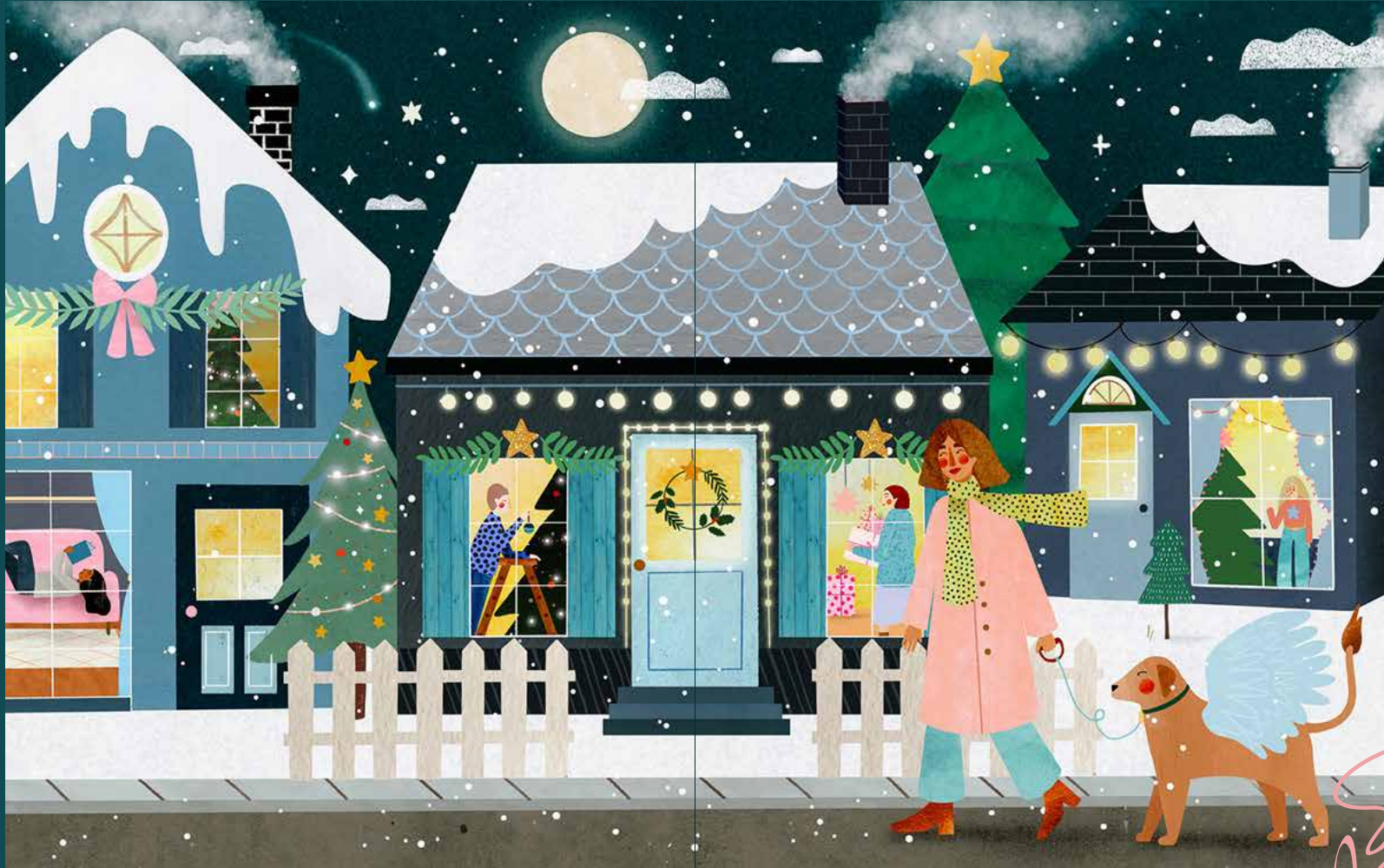
ILLUSTRATION BY LAURA LHUILLIER